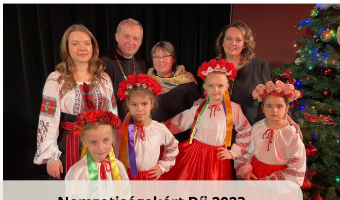
Nemzetiségekért Díj 2023