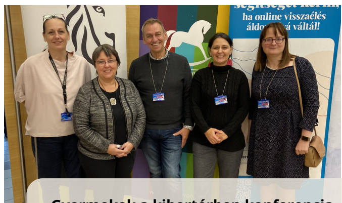
Gyermekek a kibertérben konferencia