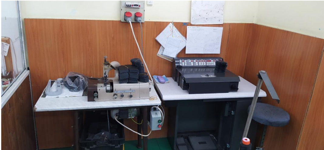
Egy munkaállomás az Ipoly Cipőgyár Kft. Intézetben lévő fióktelepén

2023. október 12-én a nemzeti megelőző mechanizmus feladatait ellátó alapvető jogok biztosa és munkatársai látogatást tettek a Heves Vármegyei Büntetés-végrehajtási Intézetben (a továbbiakban: Intézet).