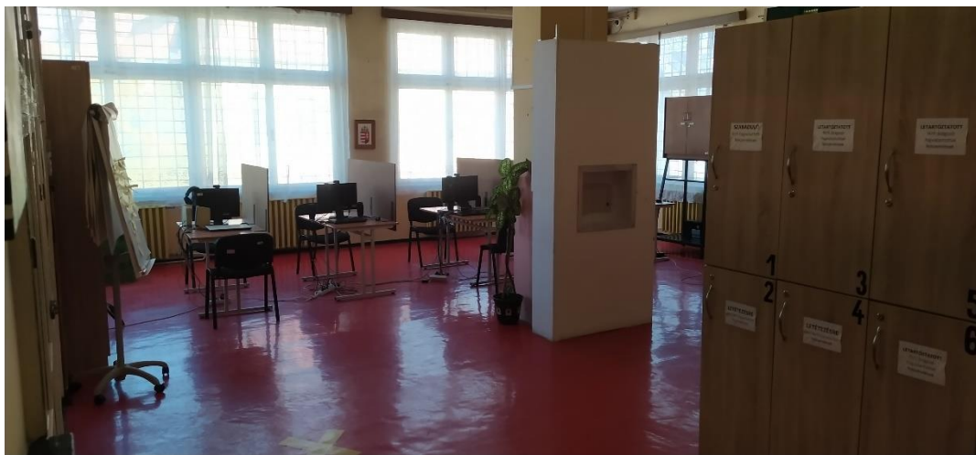
A Skype beszélők lefolytatására is szolgáló Könyvtár

A látogatás célja a fogvatartottal való bánásmód és a fogva tartás körülményeinek vizsgálata volt az objektumban.