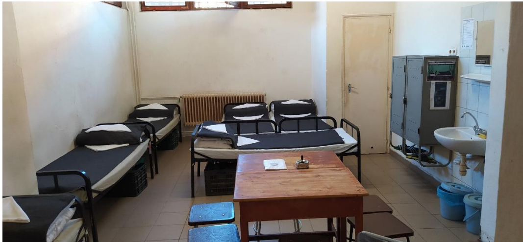
Egy dohányzó zárka belseje