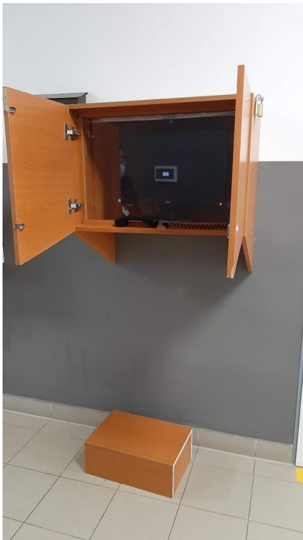
4. kép: Skype szekrény fellépővel