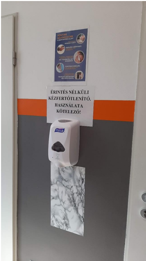
1. kép: érintés nélküli kézfertőtlenítő