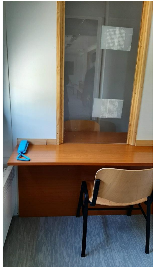
2. kép: fülkés beszélő